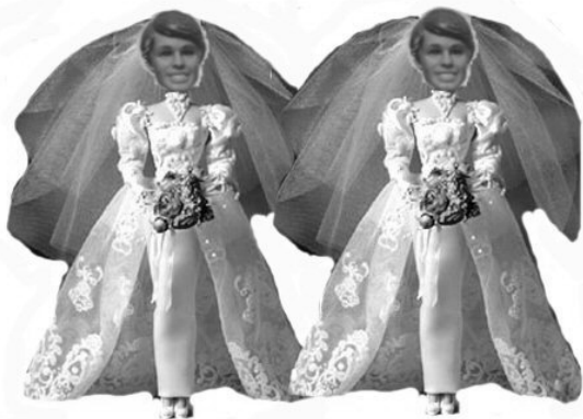
Unión civil, vivan lxs novixs....

Sabemos muy bien que la libertad que buscamos no la va a dar el derecho liberal, ninguna unión civil, ni el "turismo gay" ni nada de eso. Estamos luchando por reapropiarnos de nuestros cuerpos, y expandir nuestra lucha hacia otros sectores oprimidos, porque al igual que la lucha por construir un sistema superador del capitalismo, la lucha contra la opresión de un género por otro, la libre construcción de género y libre sexualidad debe ser de todxs.